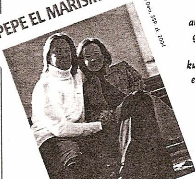
166.000. 399. zk. 2004

Itzarongela guztiefan egoten da "bihotzeko aldizkari" deiturikoren bat.