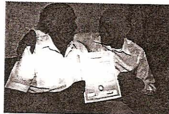
HABE 207 zk.

BIKOTE HETEROSEXUALEZ GAIN, BIKOTE HOMOSEXUALEK ERE IZANGO DUTE UMEAK ADOPTATZEKO ESKUBIDEA.