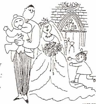
HABE 233 zk.

Eliza Katolikoak eta beste zenbait gizarte-sektorek familiaren aurkako erasotzat jo dute erabakitakoa.