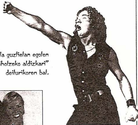
Lechuras, 2.670. zk.

Gehienetan albisteak zenikusi gutxi izaten du personaiaren kualifikazioarekin edo burutu duen lanarekin.