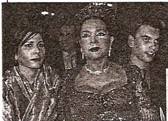
Lechuras, 2.670. zk.