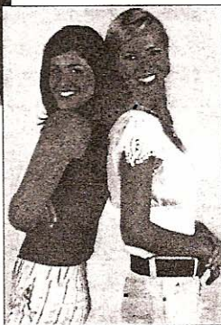
Lechuras, 2.670. zk.

Itzarongela guztiefan egoten da "bihotzeko aldizkari" deiturikoren bat.