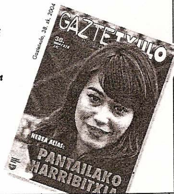
Gazteak, 38. zk. 2004

Zeloak, infidelitateak, maitemina, engainak... ehunka konfidentzia otxean sartuta teknikaren eta prentsaren bidez.