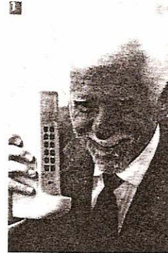
Zabalik, 209. zk. 2003-11-28

Martin Cooper-ek lehenengo deia egiteko erabili zuen DynaTAC tramankulua, 1973an.