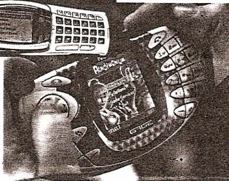
Zabalik, 209. zk. 2003-11-28

Irakasleen ustez, mezuak ortografia kaokarraren errudun.