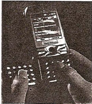
Zabalik, 209. zk. 2003-11-28

Ezin da erabili gidatzen ari garela, medikua-renean, zineman, ikasgelan...